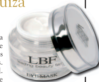
Eye Mask de LBF 92,25€

Producto específico para tratar la zona delicada del contorno de ojos y párpados reduciendo las bolsas y atenuando las ojeras. Indicado para todo tipo de piel. Acción anti-arrugas, tonificante e hidratante. Actúa sobre la circulación sanguínea y linfática.