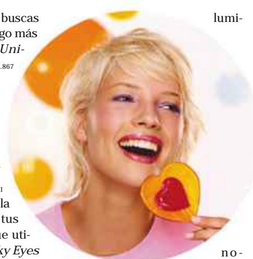
si dad a los párpados. De una

3. Sombras multicolores y en distintas texturas, para darle vida y